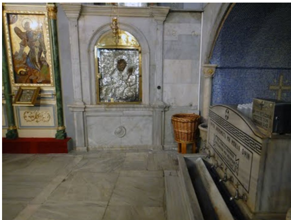
Το εσωτερικό του ναού της Παναγίας των Βλαχερνών σήμερα στην Κων/πολη, διακρίνεται η εικόνα και στα δεξιά το αγίασμα. Και η πύλη, η είσοδος στον χώρο

Κοντάκιο: «Τῆ ὑπερμάχῳ στρατηγῷ τὰ νικητήρια, ὡς λυτρωθεῖσα τῶν δεινῶν εὐχαριστήρια, ἀναγράφω σοι ἡ Πόλις σου Θεοτόκε. Ἄλλ' ὡς ἔχουσα τὸ κράτος ἀπροσμάχητον ἐκ παντοίων με κινδύνων ἐλευθέρωσον, ἵνα κράζω σοι • Χαῖρε, Νύμφη ἀνύμφευτε».